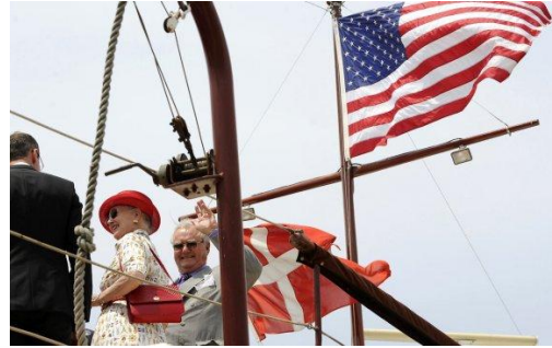
Af Thomas Breinstrup 7. juni 2011, 19:20 – USAs præsident, Barack Obama, får ikke tid til at tage imod Dronning Margrethe og prins Henrik, når de onsdag besøger Det Hvide Hus som led i et seks dage langt besøg i USA, der blev indledt

samme dag som Kronprinsen tog til Ukraine for at besøge danske virksomheder der. Der står masser af kultur og virksomhedsbesøg på det tætpakkede program, som bringer Dronningen og Prinsen til Washington, New York - og Solvang, som fylder 100 år. Regentparret kom til Washington i går og bliver i USA frem til 11. juni for at styrke de dansk-amerikanske relationer. De vil især deltage i kulturelle aktiviteter men skal også på besøg hos en række danske virksomheder. Dronningen har netop besøgt National Museum of American History for at se på en maritim udstilling, som Mærsk-koncernen har støttet, mens prins Henrik har været på rundvisning på virksomheden Mil-Tek.